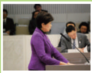
予算委員会で答弁する小池知事

都議会平成29年第1回定例会が、3月30日に閉会しました。今定例会には、小池知事が初めて編成した平成29年度予算案が提案され、子ども・子育て支援や働き方改革、教育への投資、環境施策、オリンピック・パラリンピック、行財政改革などについて、提案・質疑を行いました。また、豊洲市場移転問題の真相を解明する100条委員会を設