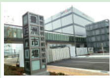
豊洲市場を視察し安全を徹底検証

豊洲市場問題で明らかになった、さまざまな裁決文書、打ち合わせ記録が東京ガスには残っていないながらも、都庁には存在していることが100条委員会で判明しました。民間企業が当たり前に行っていることもできていない状況が都政の闇をより深くし、水面下での動きが活発になると思われます。このような問題が二度と起らないよう情報公開に欠かせない公文書管理条例の早期制定に取り組むことを知事に求めました。知事は「適正文書管理を制度的に保障する条例案を次期定例会での提案を目指し、外部有識者や都民の意見を十分に聞き検討を進めていく」と答弁しました。今後も、都庁の信頼回復に向けたガバナンスの再構築に取り組めます。