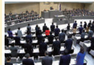
議会改革関連条例が全会一致で可決

東京の改革を進めていく上で、議会も身を切る改革が必要として、議員報酬の3割削減をはじめ、費用弁償の廃止、政務活動費の削減と情報公開及び適正化などを主張してきました。今定例会で、他会派との共同提案で、議員報酬2割削減など、議会改革関連条例が可決、成立したことは、一歩前進ですが、まだまだ改革すべき課題があります。引き続き、都議定数削減や政務活動費利用の適正化などの議会改革に取り組んでまいります。